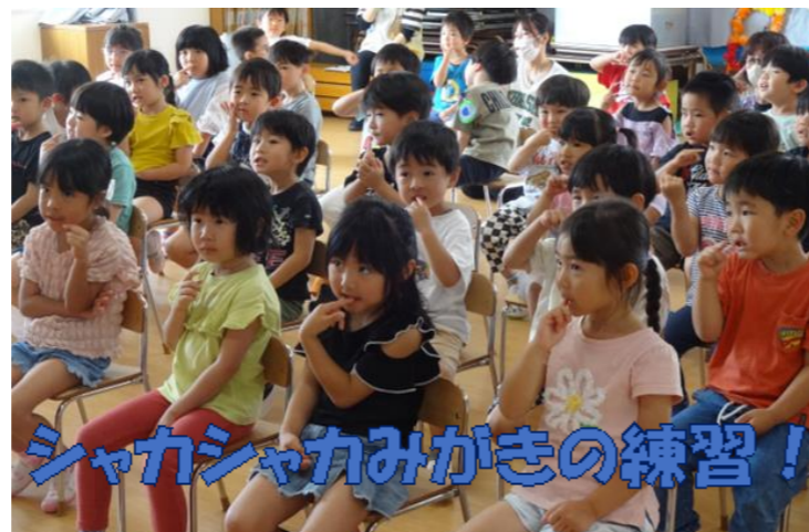
シャカシャカみがきの練習！