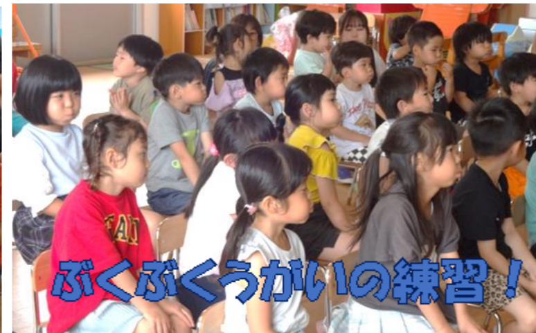
ぶくぶくうがいの練習！